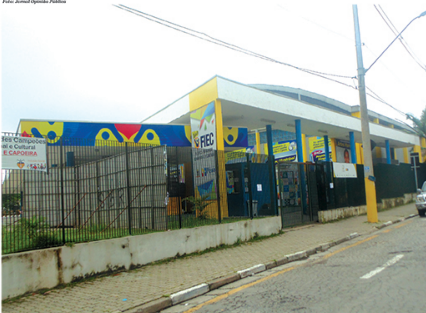
Pais de alunos reclamaram da falta de estrutura da Fiec do Parque das Américas para receber alunos enquanto escola é reformada