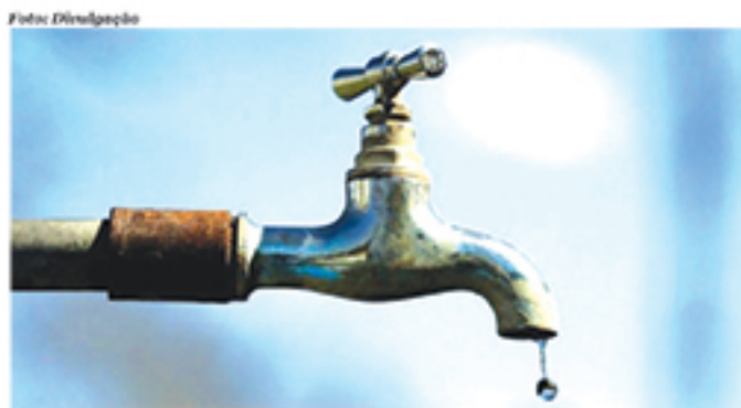
Problemas com abastecimento de água tem testado a paciência de munícipes