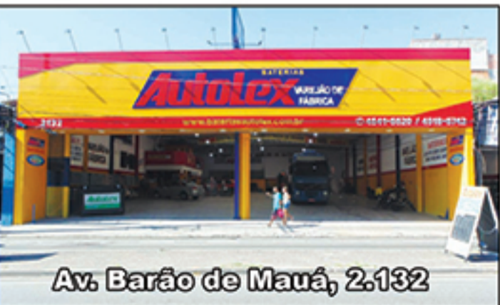
Av. Barão de Mauá, 2.132