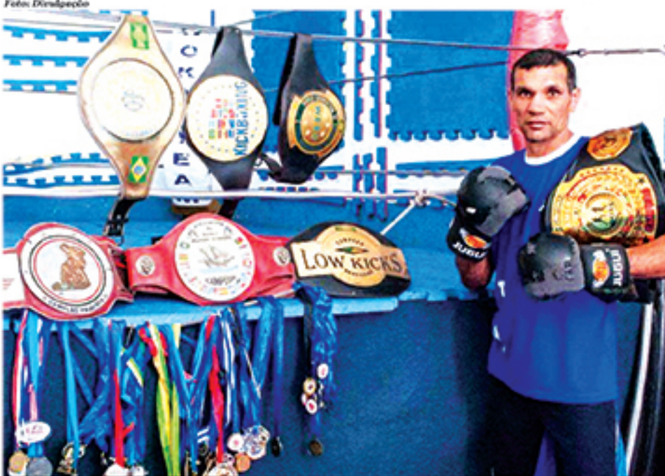
Torneio será homenagem ao tricampeão brasileiro e sul-americano Ailton Pessoa