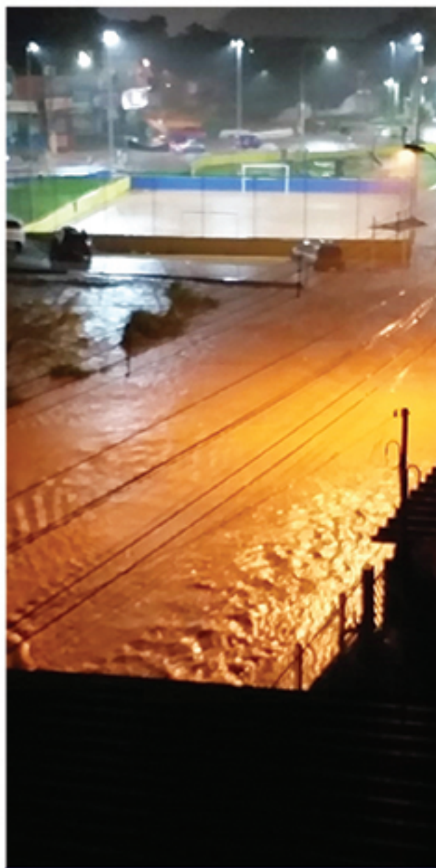
Alagamentos têm sido constantes na cidade em época de chuvas

a rua fica cheia de lixo, barro e grandes buracos em toda a extensão e o problema ainda é agravado pelo desmoronamento em parte da avenida dentro do rio, onde uma parte da via já tem uma faixa tomada pelo mato, continuamos recebendo muitas reclamações dos munícipes pelos buracos e a rua que está ca-