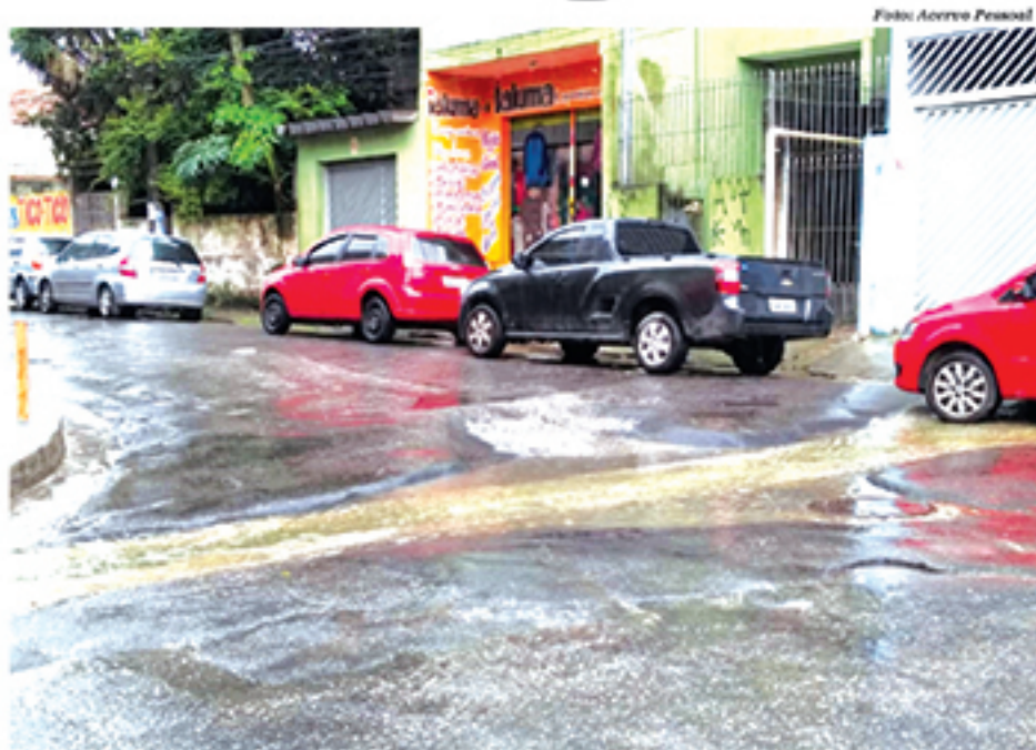
Aguinaldo de Souza cobrou mais atenção com as ruas de vários bairros de Mauá

Aguinaldo de Souza chama a atenção também para o problema de falta de segurança. "Já ocorreram assaltos na frente desta escola, os moradores reclamam da falta de segurança no bairro, temos que implantar a volta da ronda escolar em todas as creches e escolas municipais, na entrada e saída das crianças e alunos, isso vai acabar com o tráfico de dro-