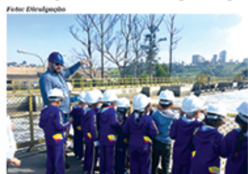
Crianças durante visita à ETE de Mauá