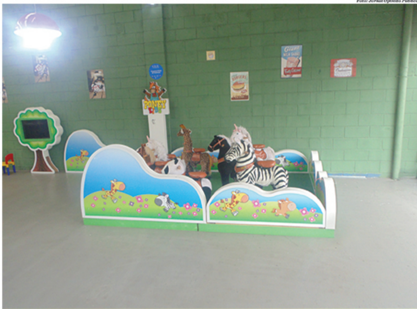
Espaço Kids é uma das novidades do restaurante e conta com diversos brinquedos para a criançada se divertir

Em termos de cardápio, o Monkey Fast-Food tem opções variadas que vão desde refeições completas a lanches, passando também por um menu voltado para o Happy-Hour. Uma destas alternativas é o Festival de Macarrão, que de acordo com o dono do restaurante recebe "100% de elogios". Além disso, o restaurante preza por um ambiente familiar, seguindo o padrão da rede. Entretanto, os franqueados têm liberdade para tentar inovar em seus restaurantes. E foi aproveitando-se disso e inspirado por ou-