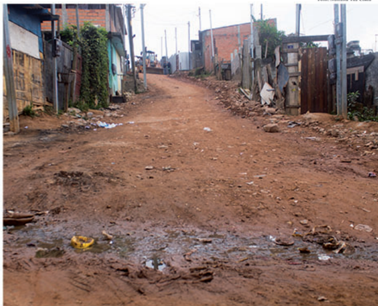
Diversas vias do Jardim Oratório ainda se encontram em uma situação como essa, sem pavimentação alguma