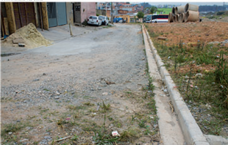
Qualidade das obras também é questionada pelos moradores do bairro