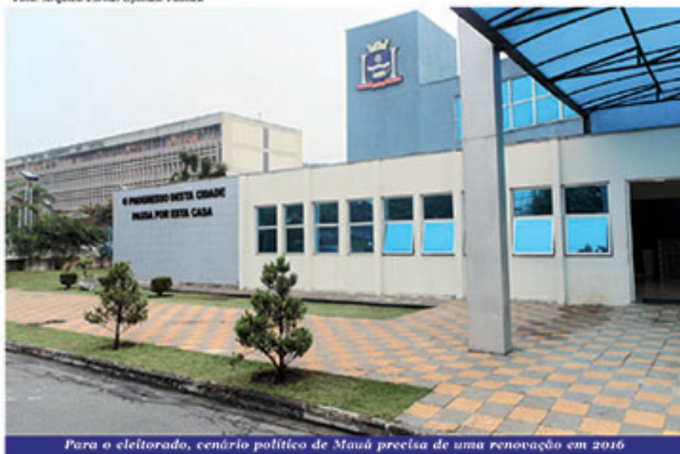
Para o eleitorado, cenário político de Mauá precisa de uma renovação em 2016

Os melhores Ingredientes, O Melhor Sorvete.