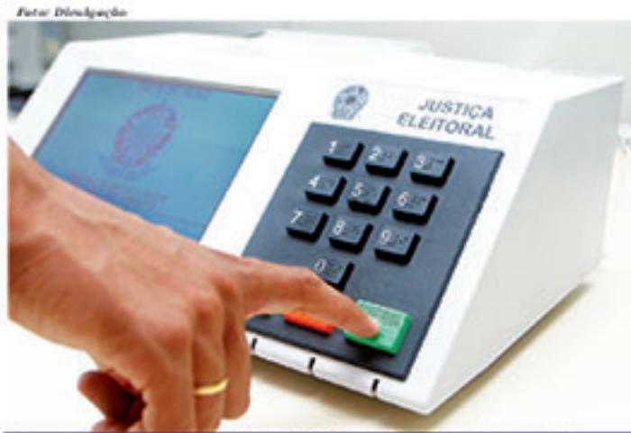
Campanha eleitoral teve início na última terça-feira (16)