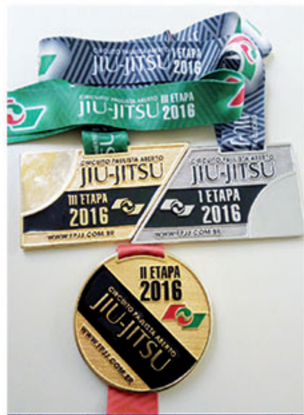
Medalhas conquistadas pelo atleta mauaense nesta temporada

O campeão do Circuito Paulista de Jiu-jitsu finalizou fazendo um chamado para a competição que acontecerá na cidade