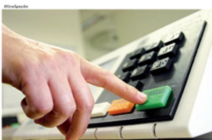
Planejamento é a chave para que PDT siga elegendo novos parlamentares