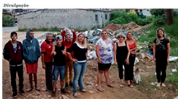
Moradores do Jardim Miranda reclamam de lixo em avenida do bairro

“Que a LUZ do Senhor Jesus ilumine seus lares, seus caminhos e suas vidas”