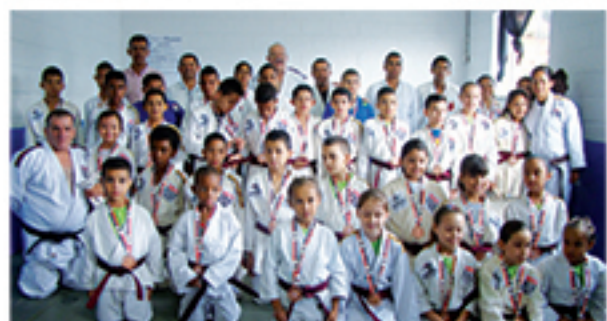
Judocas do Centro de Esportes do Jardim Zaira 6