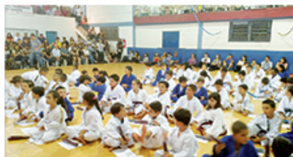
Parte dos judocas do Colégio Monsenhor Alexandre