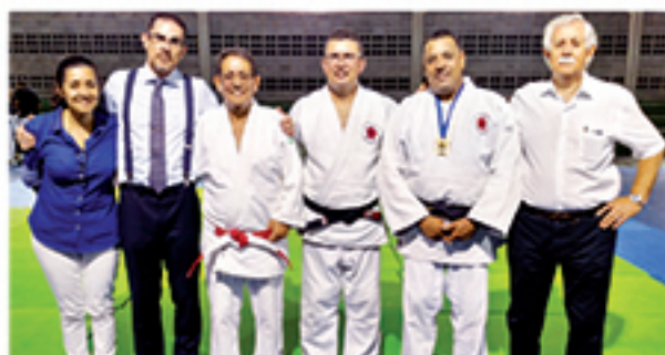
Diretores e professores presentes na cerimônia do Colégio Leonardo da Vinci