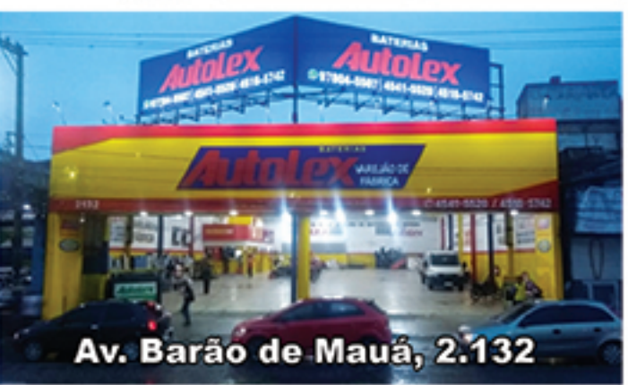
Av. Barão de Mauá, 2.132