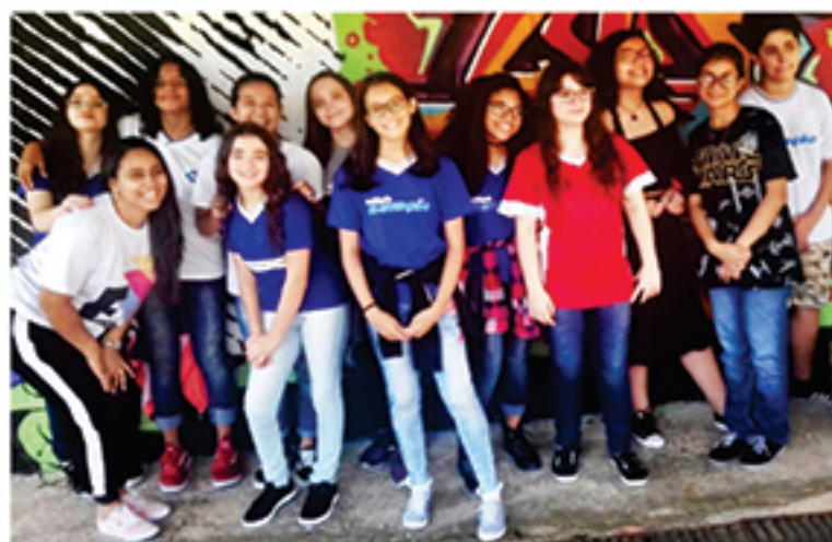
Visita ao Abrigo