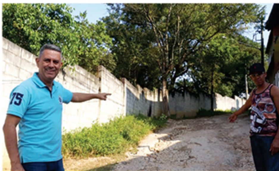
Rua Santa Tereza, no Jardim Luzitano, precisa de asfaltamento e serviço de capinagem