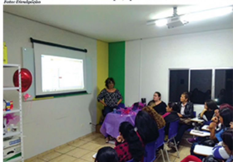
Diversos temas que trazem informações importantes às mulheres foram abordados nas palestras