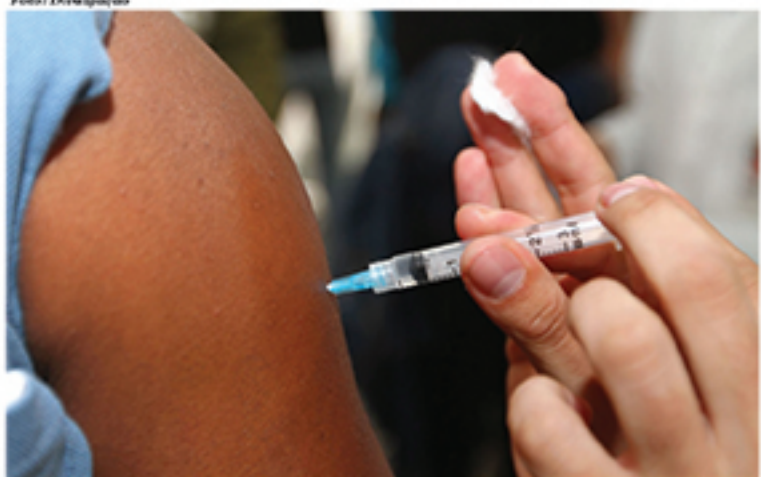
Mais de 7 mil pessoas foram vacinadas contra a gripe no Dia D da campanha em Mauá