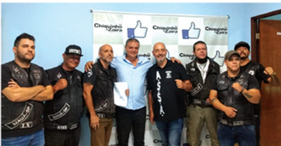
Dia Municipal do Abutre's Moto Clube foi aprovado em Mauá para ser comemorado no dia 13 de setembro