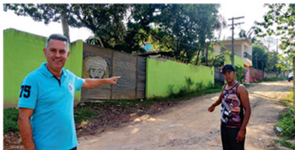
Rua Ana Rosa de Souza, no Recanto Vital Brasil, vira barro quando chove

de, como o mato alto, as ruas esburacadas, e sem asfalto, além dos constantes cortes no fornecimento de água para a população que perduram sem nenhuma justificativa. "Vou continuar buscando junto ao poder público uma solução