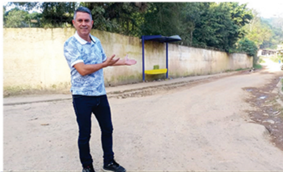
Rua Roteldamo Bonini, na Chácara São Braz, é alvo de reclamações por falta de asfalto