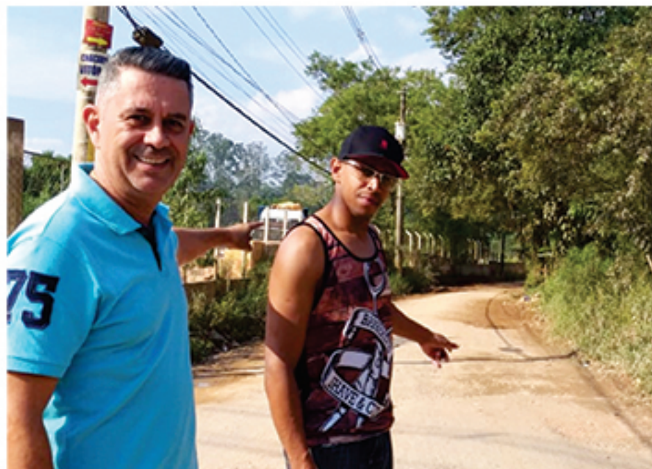
Estrada Nossa Senhora do Pilar, no Jardim Luzitano, também é alvo de reclamações

O empresário destacou problemas que os moradores dessas localidades enfrentam diariamente.