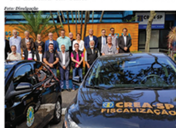
Grupo do CREA reunido para fiscalização no Grande ABC