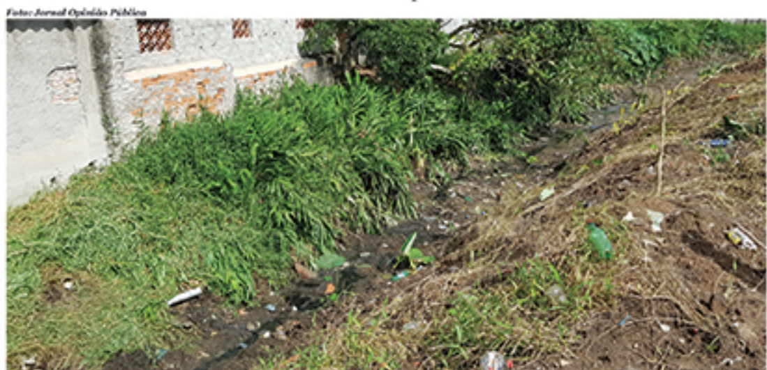
Sujeira e mau-cheiro têm incomodado moradores do Jardim Itapeva. Exposição a doenças também preocupa