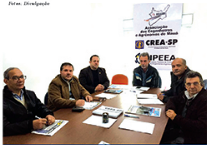
Reunião da CAF-Mauá de agosto de 2018