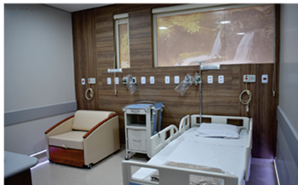
Novos leitos da Santa Casa de Mauá possuem equipamentos modernos para melhor atender seus pacientes

"Agora que a situação política está estabilizada, estamos aguardando a prefeitura pagar o que nos deve para que a gente possa definir um novo plano de