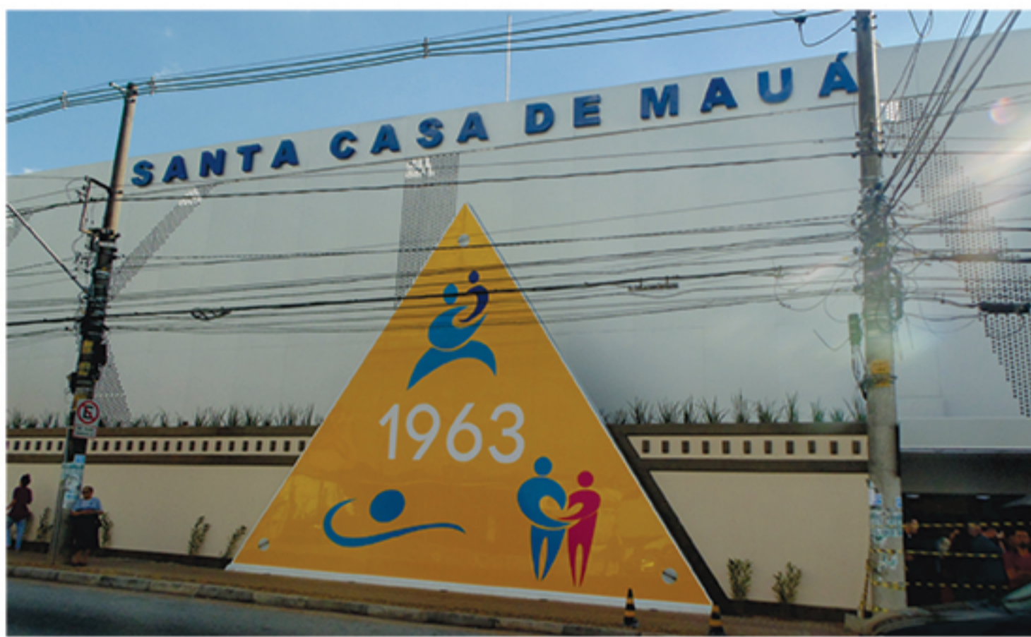
Obras fazem parte do projeto de ampliação do hospital e trazem novidades que visam aumentar o bem-estar dos pacientes, como atendimento informatizado e leitos modernos

Mauá F. C. vence e avança na Segundona; Mauaense é eliminado