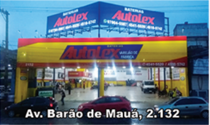
Av. Barão de Mauá, 2.132