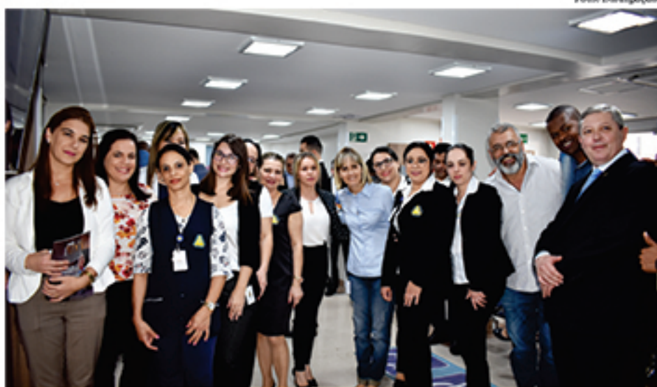
Equipe da Santa Casa de Mauá e convidados estiveram reunidos para prestigiar a inauguração

que marcam os 53 anos de fundação da entidade, serão gerados 35 postos de trabalho, dos quais 20 diretos e 15 indiretos.