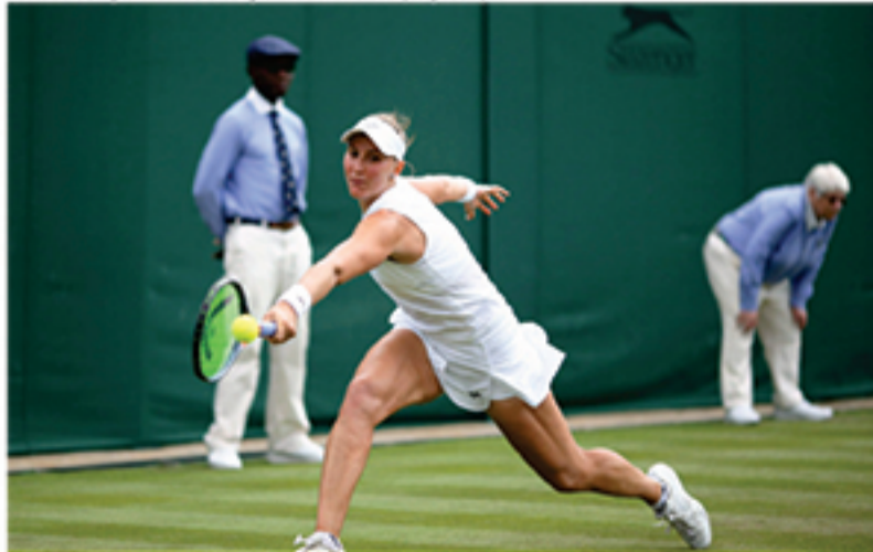
Bia Haddad Maia enfrentará tenista da casa na Segunda rodada de Wimbledon