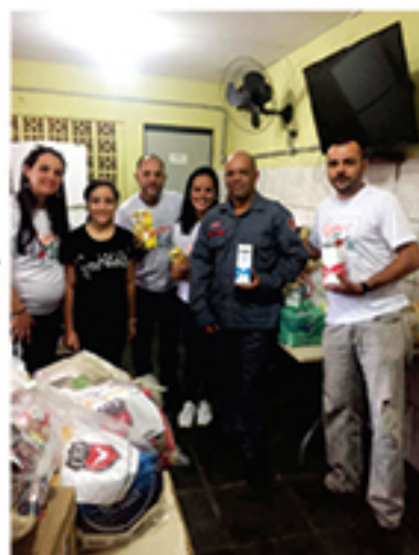
ais do projeto 'Quero Leite'.