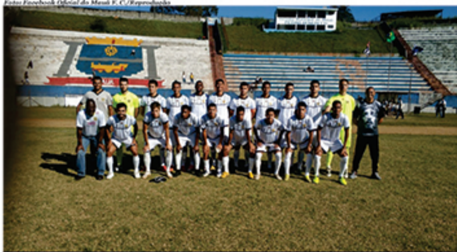
Mauá F. C. conseguiu classificação para próxima fase da Segundona e estará no grupo 9