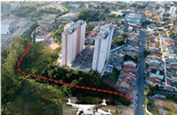
Foto aérea de terreno do Jardim Pedroso, onde drone foi utilizado pela primeira vez