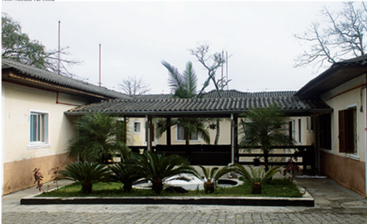
Recebendo verba da Prefeitura que é insuficiente para seu funcionamento, asilo Lar Zaira tem realizado eventos para poder arrecadar fundos e doações