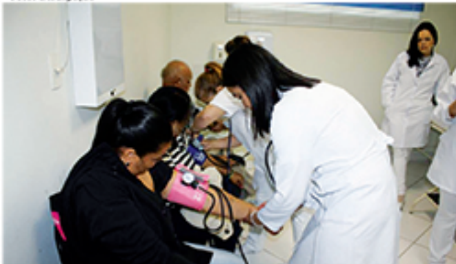
Hospital Vital realizou mutirão da saúde, oferecendo diversos tipos de consultas à população