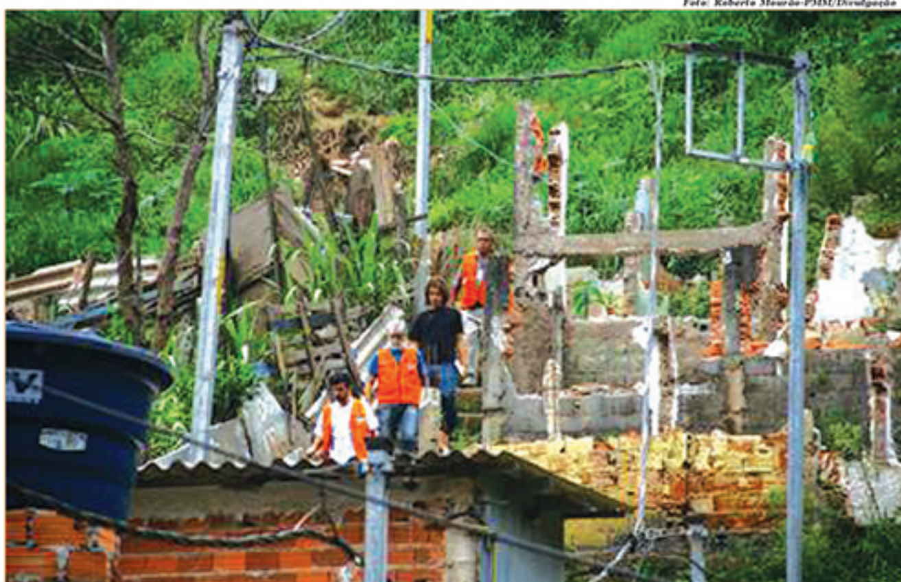
Cidade passou por vários tipos de monitoramento em suas áreas de risco, mas teve poucas ações efetivas

O empresário Aguinaldo de Souza aponta os principais problemas do crescimento desordenado de moradias irregulares na cidade. "O crescimento desorganizado é prova da fal-