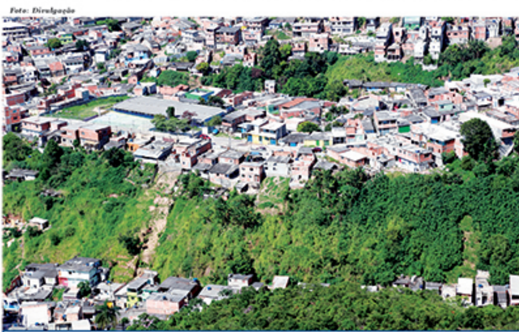
Imagem aérea do Jardim Zaira, de 2014, quando a Prefeitura fez um monitoramento na região. Bairro é um dos que mais possuem áreas de risco na cidade