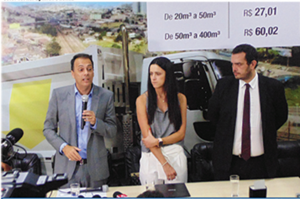
Atila reassume o Paço pela segunda vez, após ser libertado na última sexta-feira