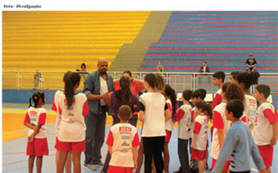
Festival quer oportunizar aos jovens possibilidade de praticar várias modalidades