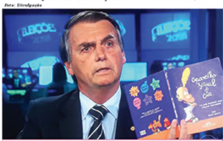
Em vídeos, Bolsonaro atribuiu distribuição de "Kit Gay" a Haddad. Material nunca chegou a escolas.