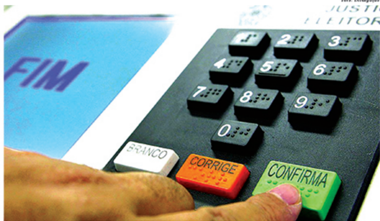
Pesquisa Ibope aponta que Jair Bolsonaro tem boa vantagem no segundo turno diante de Fernando Haddad.

ra (15), o Instituto Paraná Pesquisas e Análise do Consumidor apontou que o ex-prefeito de São Paulo, João Dória (PSDB), está liderando a corrida pelo governo do Estado. De acordo com o levantamento, o