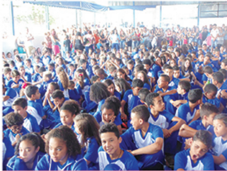
Evento irá homenagear professores que tiveram papéis importantes nas vidas de seus alunos