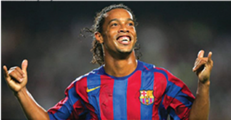
Barcelona irá analisar caso de Ronaldinho com relação a apoio a Bolsonaro

municado afirma ainda que a análise se deve ao fato de que há preocupação de como o caso pode "afetar a imagem do clube".