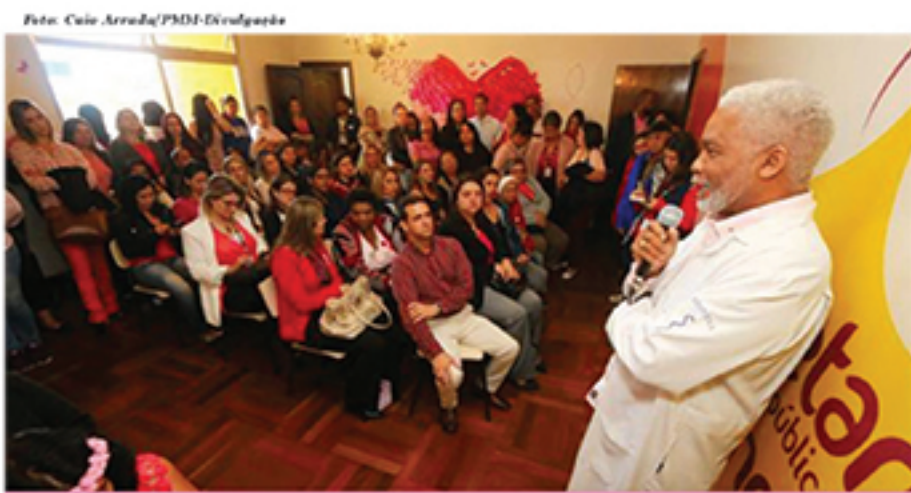
Secretaria de Políticas Públicas para Mulheres organizou palestra para tratar do assunto câncer de mama no início do mês