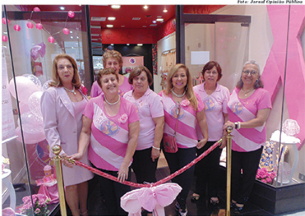
REFEMA tem desenvolvido diversas ações nas últimas semanas. Uma delas foi a abertura de uma loja no Mauá Plaza Shopping para venda de artigos de artesanato