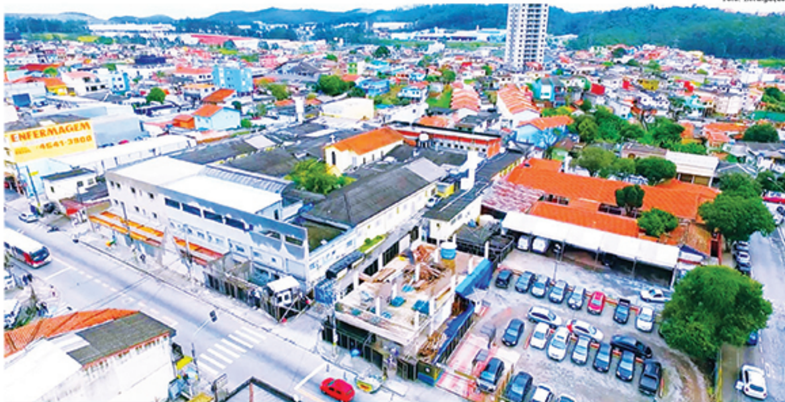
Santa Casa de Mauá está desenvolvendo diversas ações em comemoração ao Outubro Rosa

No caso da Campanha de Arrecadação de Lenços, as doações poderão ser entregues no próprio hospital (avenida Dom José Gaspar, 1374 - Vila Assis Brasil), nos Ambulatórios de Especialidades e 2, Policlínica - Plano de Saúde Santa Casa (Av.