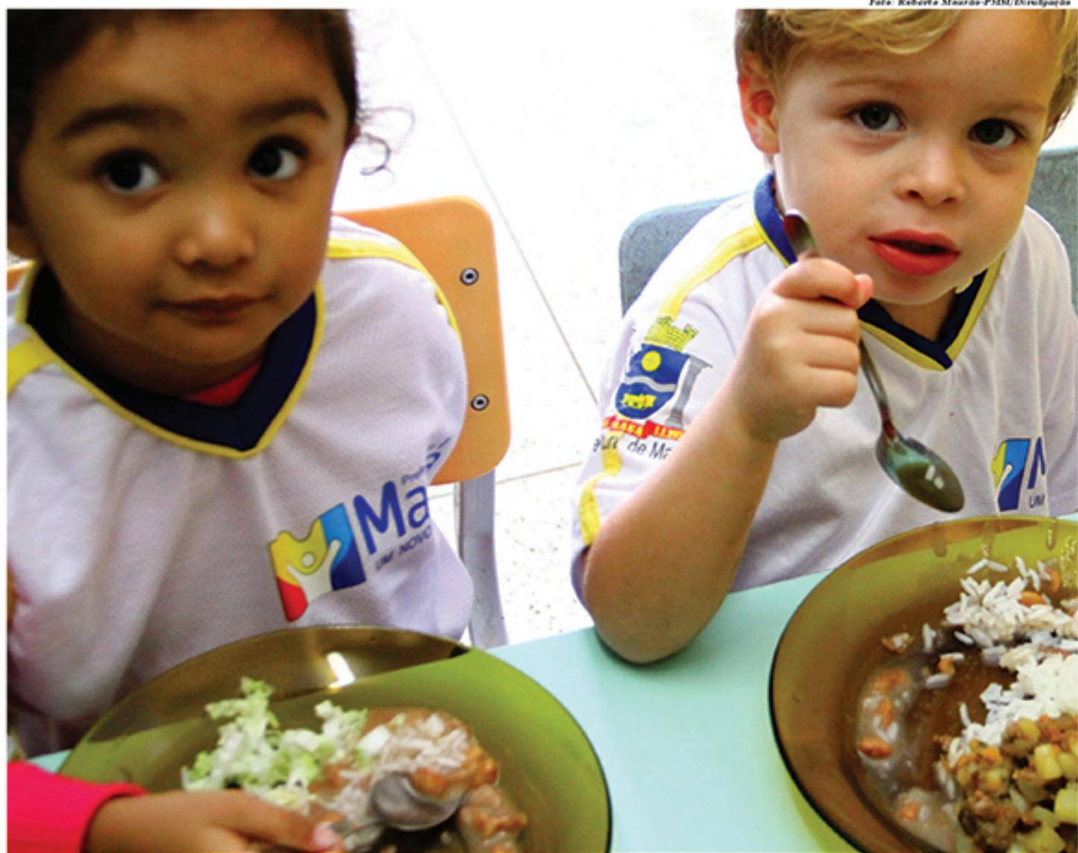
Segundo a Prefeitura de Mauá, a cidade não possui contratos com empresas investigadas na “Operação Prato Feito”

O questionamento do Jornal Opinião Pública também foi feito pela Câmara Municipal, que apresentou requerimento assinado por todos os 23 vereadores na última sessão ordinária, na terça-feira (22), em que listam em-