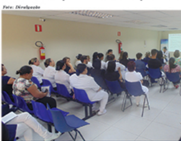
Palestras na Semana da Enfermagem abordaram vários temas