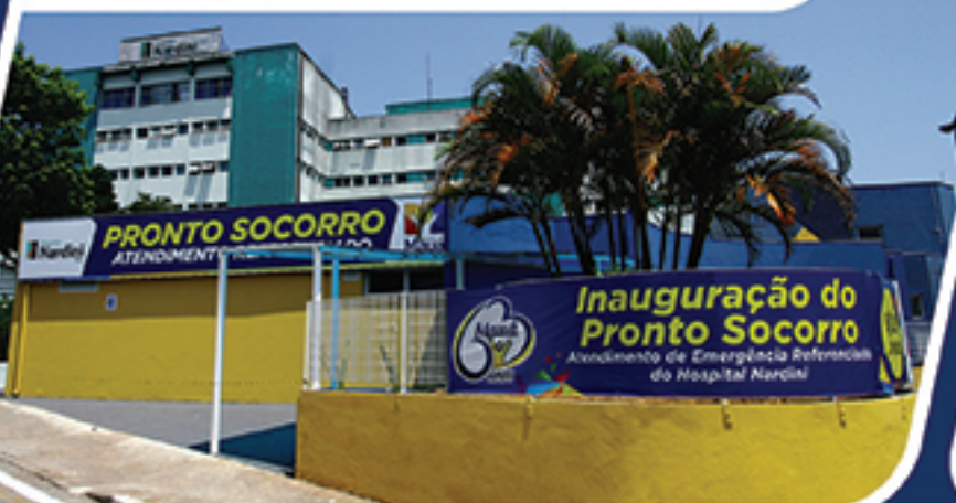
REVITALIZAÇÃO • HOSPITAL NARDINI