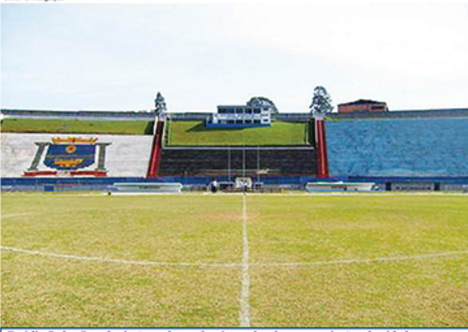
Estádio Pedro Benedetti não pode receber jogos das duas agremiações da cidade enquanto não for adequado às determinações do Departamento de Infraestrutura de Estádios