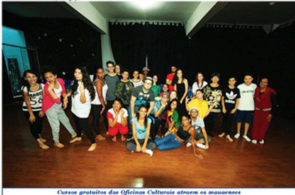
Cursos gratuitos das Oficinas Culturais atraem os mauaenses