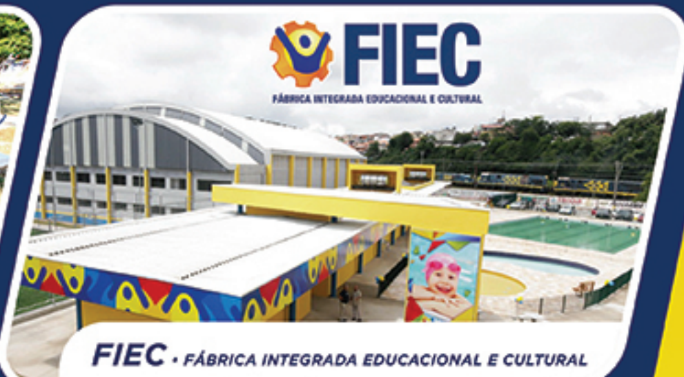
FIEC • FÁBRICA INTEGRADA EDUCACIONAL E CULTURAL