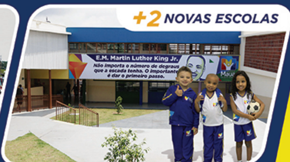
+2 NOVAS ESCOLAS

A Prefeitura de Mauá trabalha com planejamento, respeito e muita dedicação para melhorar cada vez mais a sua qualidade de vida.