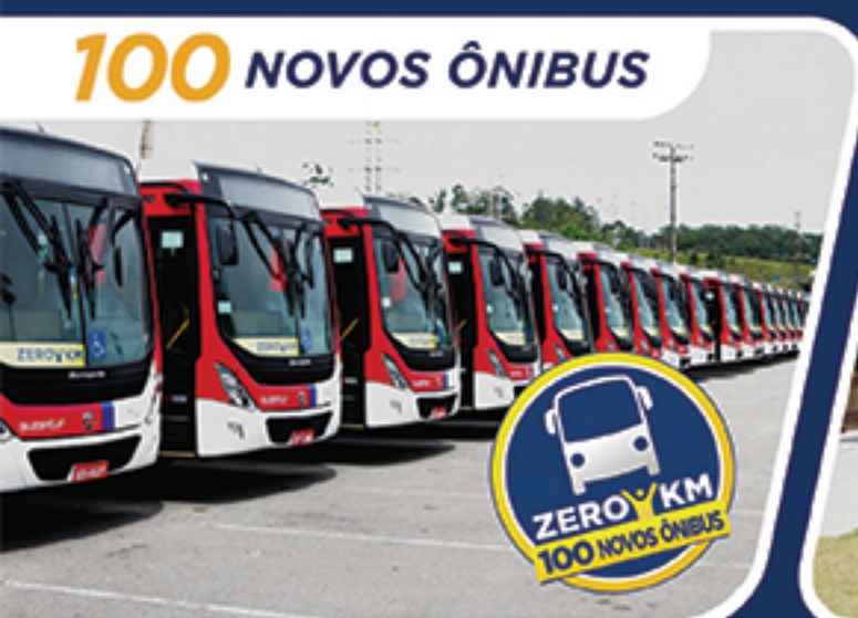
ZERO KM 100 NOVOS ÔNIBUS