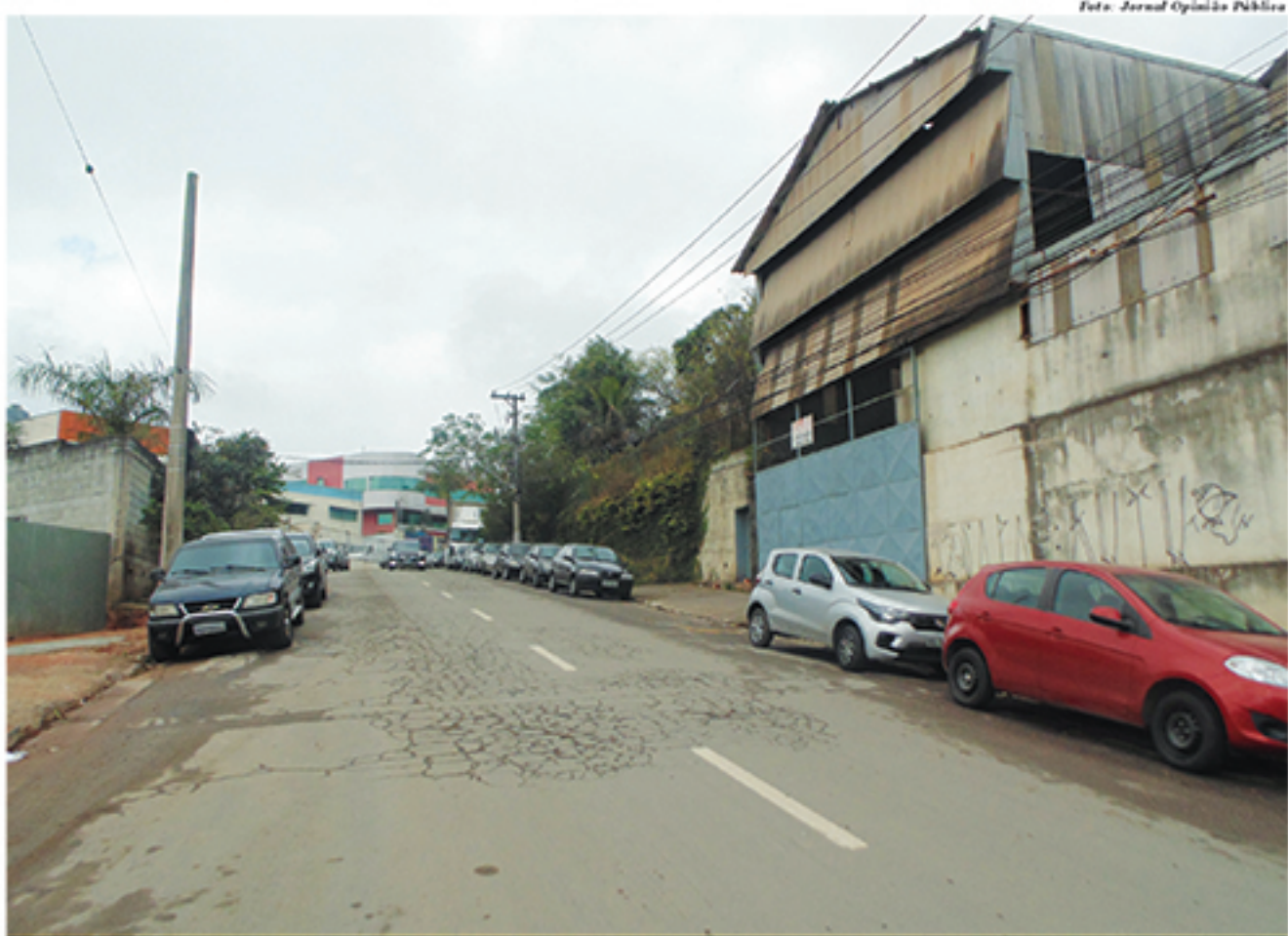
Empresas no condomínio Acibam têm sido alvo de bandidos nas últimas semanas