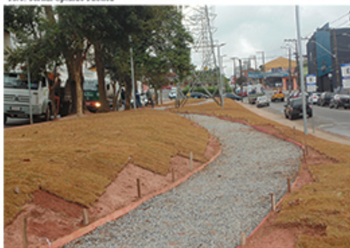
Praça estaria sendo construída de forma ilegal no Jardim Haydee