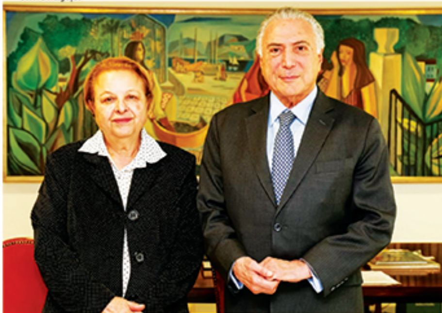
Alaíde Damo foi à Brasília em busca de recursos para Mauá e se encontrou com o presidente Michel Temer