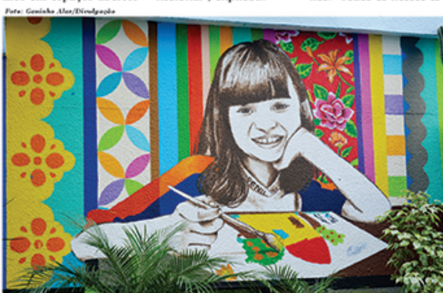
Pinturas de Aleksandro Reis podem ser vistas em murais no colégio

forços miram a formação de nossos alunos e aprimoramento de nossos professores e funcionários. Por isso, resolvemos aplicar a arte por intermédio da pintura em espaços de destaque em nosso prédio sede. Com esse trabalho recebemos não só o retorno em satisfação por parte de nossos escolares