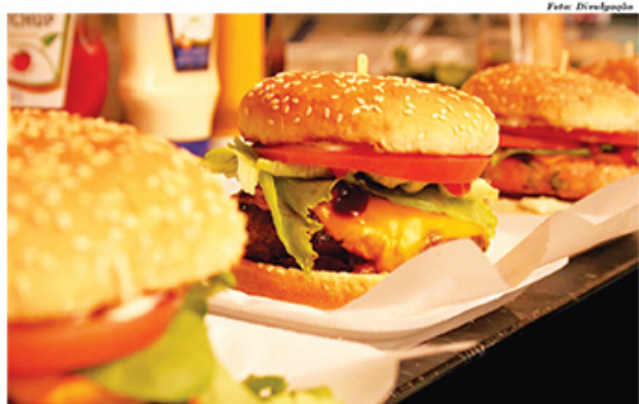
Hambúrgueres artesanais fazem sucesso entre os clientes do Rancho do Cavalo

bar, a questão dos drinques e do cardápio de porções e as atrações. Antes, aqui tinha só moda de viola, algo bem mais de raiz. Agora, apostamos em mais diversidade", contou o proprietário do Rancho.