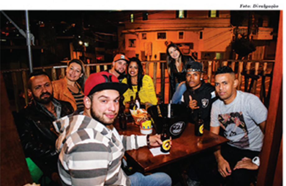
Varietade gastronômica, bom ambiente e boa música são alguns dos atrativos do Rancho

os domingos, chamados de "Domingão do Cavalo", são reservados a um clima mais familiar, com shows de pop-rock ou sertanejo. E todas essas mudanças trouxeram o efeito esperado. "Conseguimos atingir a todos os segmentos, tanto a juventude quanto as pessoas mais velhas. É um mix", lembra Sanchez.