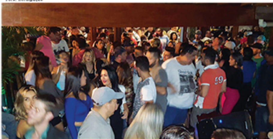
Público tem crescido constantemente no Rancho do Cavalo. Nas quintas, sextas e sábados o bar sempre está cheio

deixando-o mais atrativo. "Trouxemos o 'garden', com as plantas, mudamos as cores do bar, deixamos o ambiente mais intimista, com a troca do sistema de iluminação, trocamos o