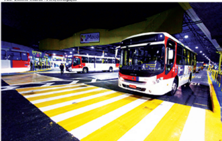
Reforma do Terminal Rodoviário foi entregue na última terça-feira com várias novidades