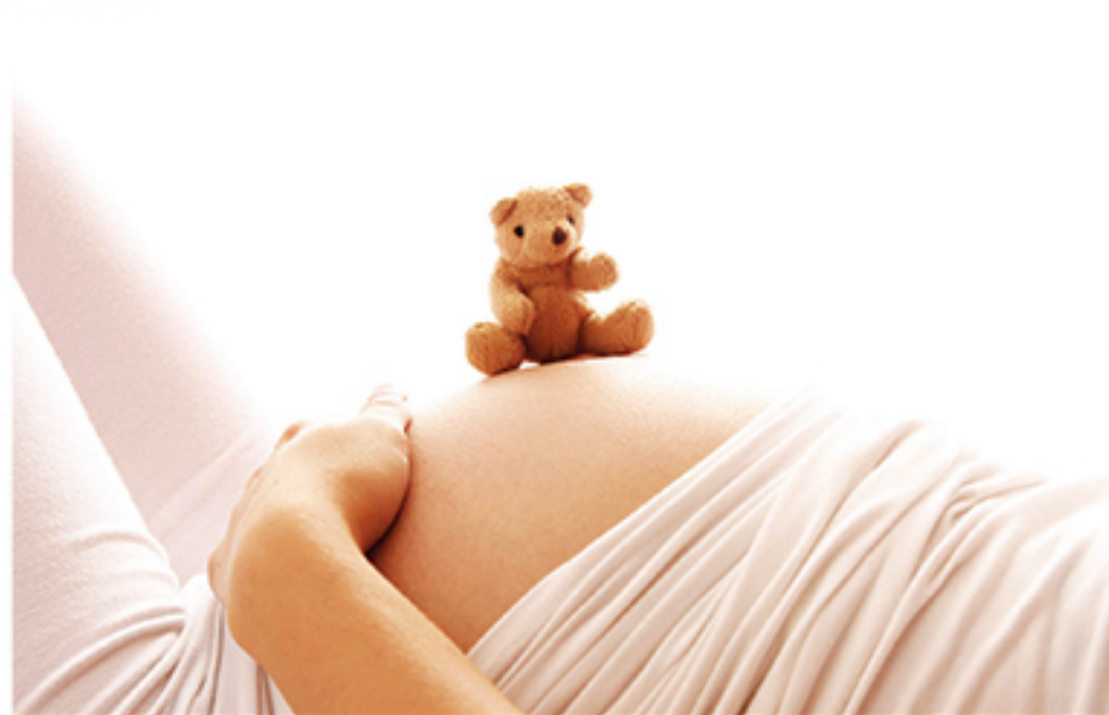
Ministério da Saúde afirma que tem investido em campanhas educativas para que números de casos de gravidez na adolescência sigam diminuindo

cia foi de 17% em todo o País entre os anos de 2004 e 2015. Em números absolutos, a redução foi de 661.290 nascidos vivos de mães entre 10 e 19 anos em 2004 para 546.529 em 2015. Ainda segundo o balanço, a região Nordeste é a que possui mais filhos de mães adolescentes (180.072 - 32%), seguida da região Sudeste