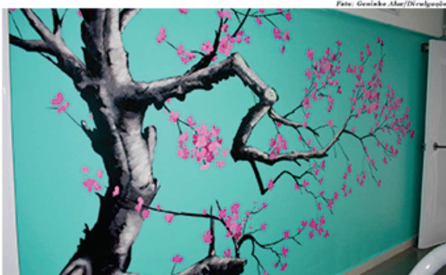
Além da beleza estética provocada pelas pinturas nos murais, a direção do Colégio Renil acredita que a arte contribui para o aprendizado dos alunos

A direção do Colégio Renil destacou a relevância da arte como contexto de aprendizado. Para a direção, as pinturas no prédio da escola buscam não só a melhor forma estética e embelezamento, mas a expressão cultural como um todo, levando a reflexão pessoal aos alunos. "Todos os nossos es-