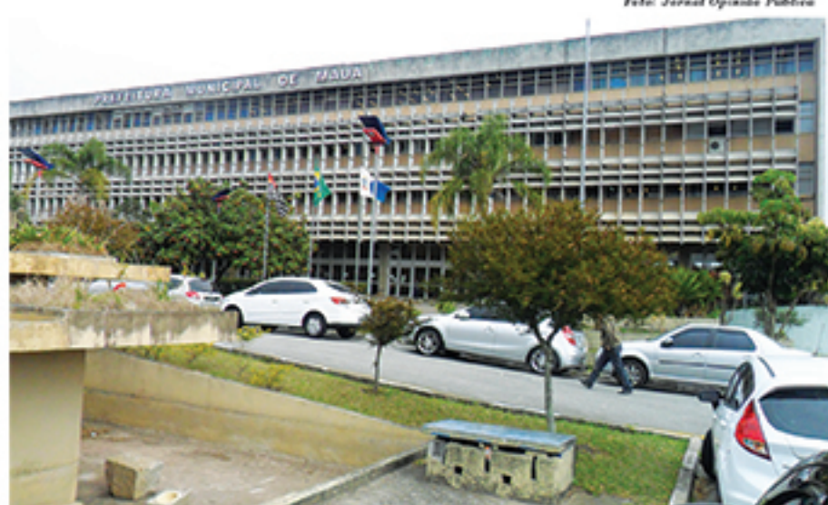
Com desmembramento e criação de secretarias, atual gestão realizou algumas mudanças pontuais