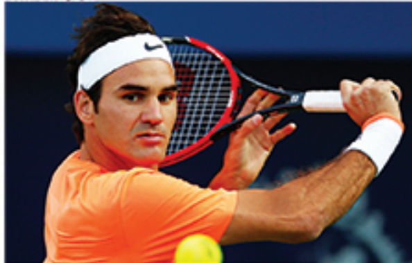
Roger Federer foi campeão em Roland Garros uma vez, em 2009